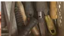
Opruiming van oude spullen