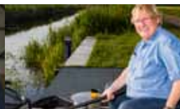
Onthaasten: gaan vissen geeft rust