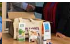
Opdracht inpakken Kerstpakketten