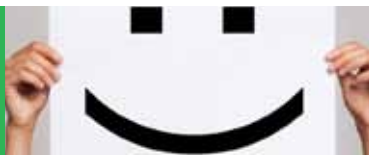
Mooi rapportcijfer MTO