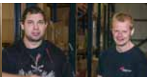
Aan de slag bij Landmark Global