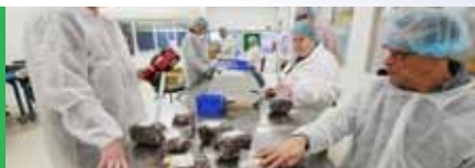
Samenwerking met De Zijlen