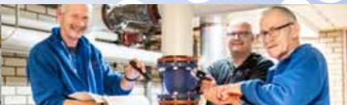
Aan de slag bij Vredewold