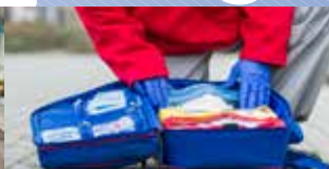
EHBO is mijn hobby