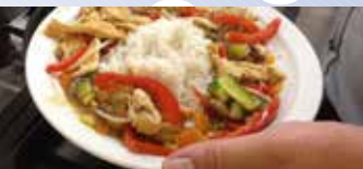
Gezondheidsweek goed bezocht