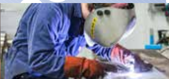
Rvs lassen bij VTL