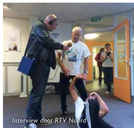
Interview door RTV Noord