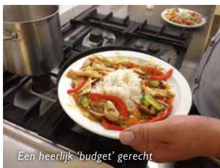
Een heerlijk 'budget' gerecht

Alle mensen die de gezondheidsweek mogelijk hebben gemaakt: bedankt! Dat geldt zowel voor de organisatoren als voor de medewerkers die hebben deelgenomen. Maar ook de medewerkers die zich niet hadden ingeschreven voor een activiteit verdienen een compliment. Het was namelijk een van de drukste weken van het jaar en er zijn op de afdelingen desondanks in een prima sfeer bergen werk verzet. Hulde!