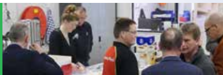
Post overgedragen aan Cycloon