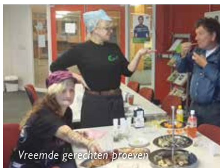
Vreemde gerechten proeven

Regelmatig bewegen en gevarieerd eten is goed voor onze gezondheid. We weten het allemaal, maar het valt niet altijd mee om dit verstandige advies in de praktijk te brengen. Een zetje in de rug, zoals de Gezondheidsweek, kan helpen. En het was nog leuk ook! We kijken terug op een spetterende gezondheidsweek in het beschutte werkbedrijf. Ook na de startweek gaan we door met allerlei activiteiten.