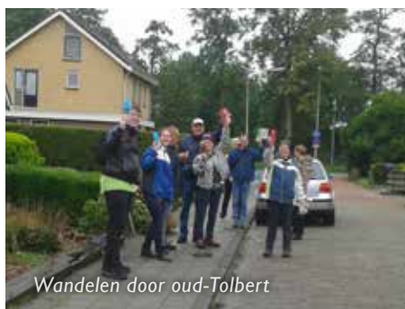
Wandelen door oud-Tolbert