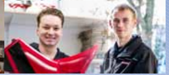
Wajongers naar werk