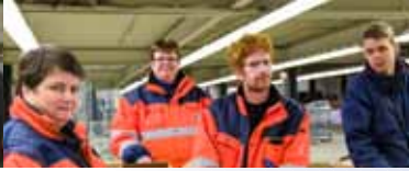
Aan de slag voor Topbrands