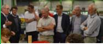
Vlamingen op bezoek