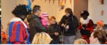
Kinderen verrast door Pieten