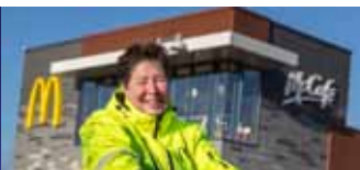
Aan de slag bij McDonald's