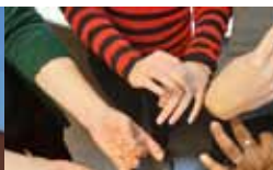
Les in gebarentaal