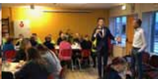
Gemeente loopt mee