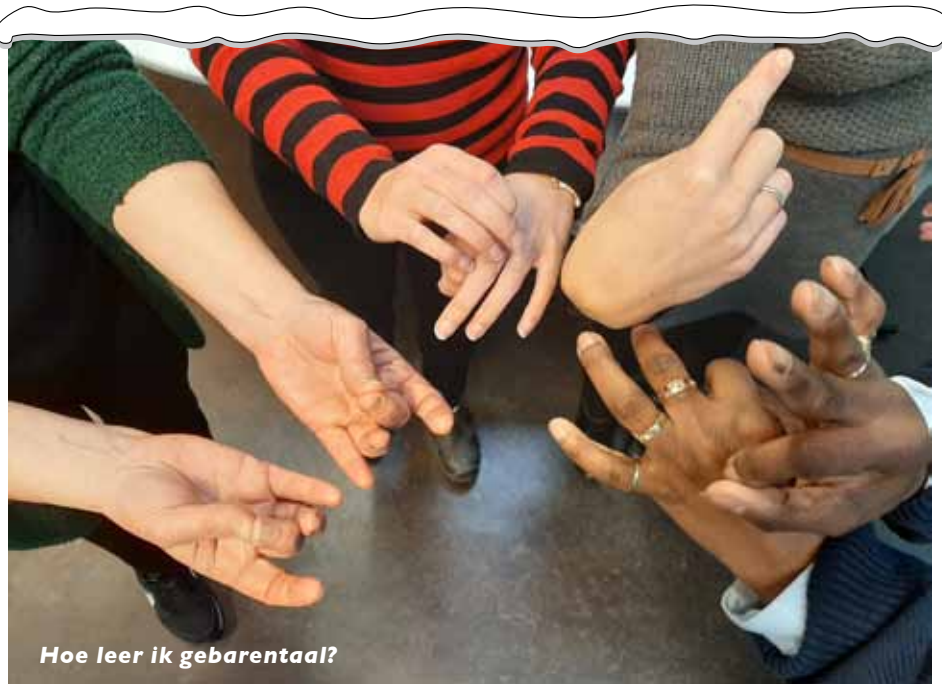
Hoe leer ik gebarentaal?

digde vorm van gebarentaal ook aan de directe collega's van onze dove medewerker te leren.