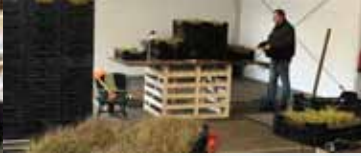
Extra werkruimte voor Kwekerij