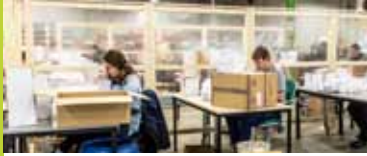
Novatec in 2021