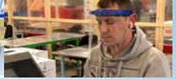
Productie draait 'gewoon' door